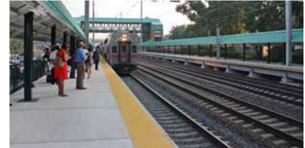
Estación de Tren MARC Halethorpen; Baltimore, MD