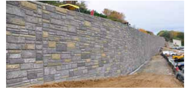
Muro de Contención Smithsonian National Zoo; DC