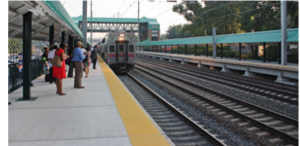
Estación de Tren MARC Halethorpen; Baltimore, MD