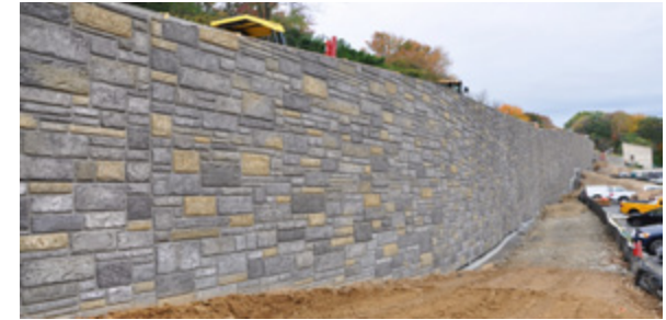
Muro de Contención Smithsonian National Zoo; DC

Posiciones vacantes pueden verse en www.SmithMidland.com/careers